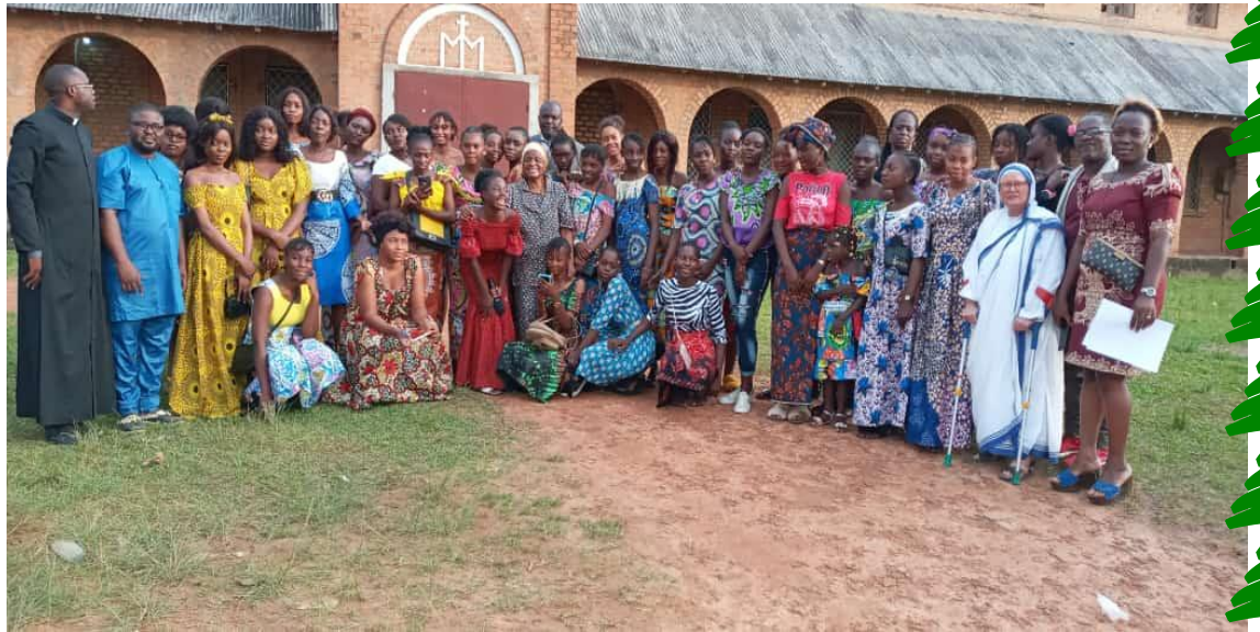
Le Responsable de l'Equipe Diocésaine et Président de l'aumônerie ont organisé une activité pastorale à l'occasion de la journée de 8 mars 2022